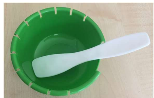
④滅菌された状態の製品（ボ ウルとヘラ）が入っております。 （滅菌）