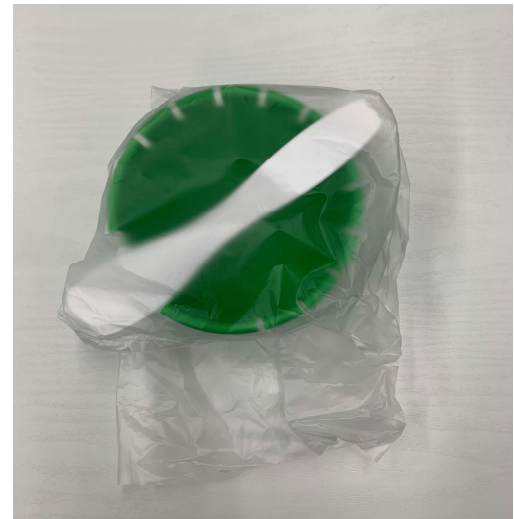
③半透明の未密封の袋 に製品が入っております。 （滅菌）